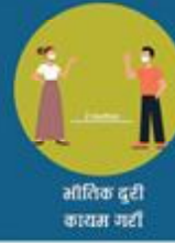
भौतिक दूरी कायम गर्नु