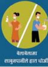
बैसायनामा साबुनपानीले हात धोऔं